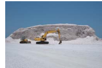
(上) 大量に野積みされ、産業廃棄物と化しているホタテ貝殻 (右) ホタテは二枚貝。扇の形をした優美な貝で、貝殻は薄いのに強靭です

ホタテ貝殻にはニオイを吸着分解するチカラがあります。それだけでなく、優れた抗菌除菌機能があり、カビやダニの発生も抑制。また、シックハウスの原因となる空気中の有害化学物質やウイルスも吸着分解してくれます。