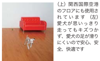
(上) 関西国際空港のフロアにも使用されています (左) 愛犬が思いつき走り回ってもキズつかず、愛犬の足が滑りにくいため安心、安全、快適です