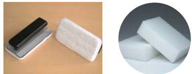
床面を塗るときは左のフックモップ、入り組んだ場所や小面積に塗るときは右のメラニンスポンジが便利